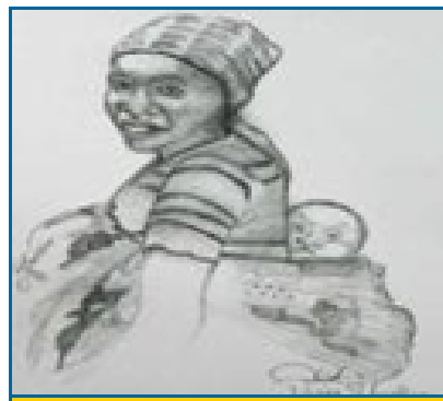
moo yě - her child