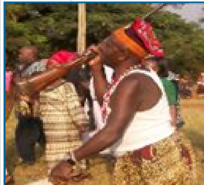
atàa wà My father