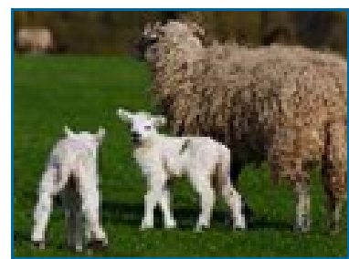
ndəmò wwò Your relative

wà, wwò, yě, wĩ, wwǎ, wũ ( mine, yours, his/hers, ours, yours, theirs )